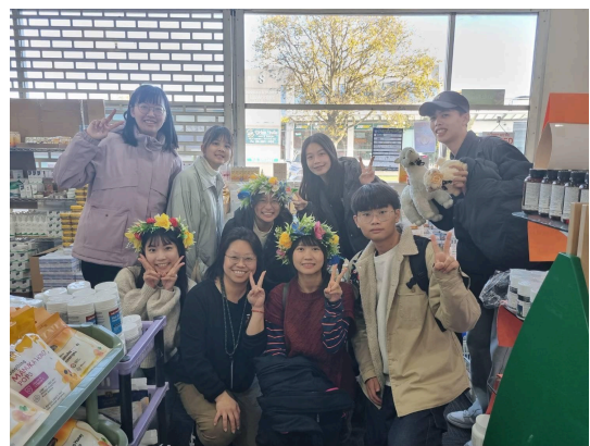
學生與當地師長合照