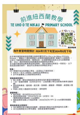
紐西蘭計畫的招生海報