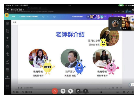
紐西蘭計畫線上說明會