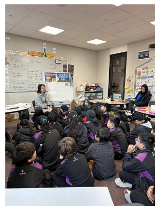
學生觀副校長的閱讀策略課