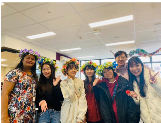
學生與當地師長合照