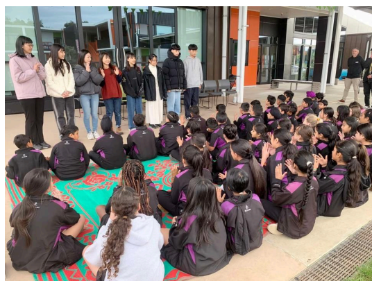
學生接受寬可心小學的毛利入校儀式