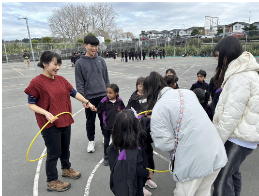
學生進行體育課教學