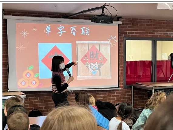
帶領三位學生至英華學院海外實習