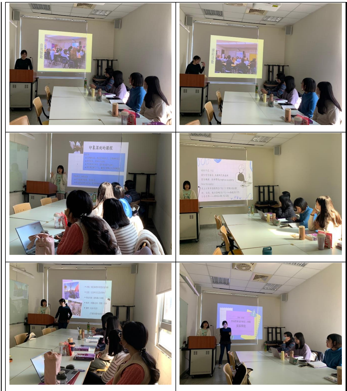
學生進行公開分享 經驗交流