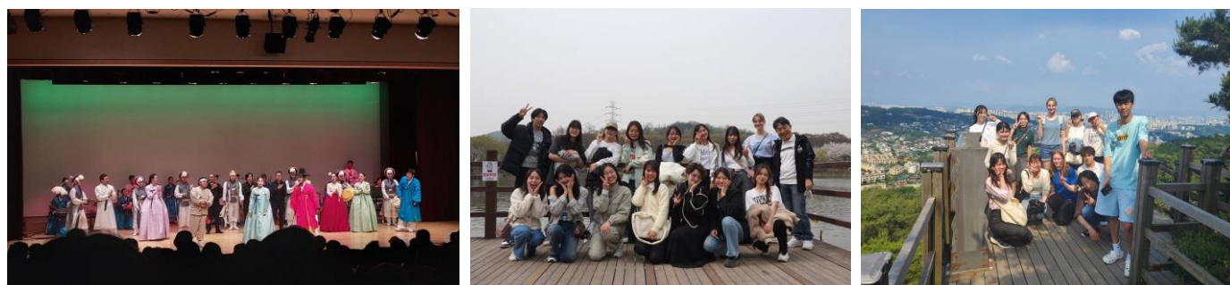
圖四：韓文課校外教學

在兩學期的韓文課上我都有參與校外教學，上學期是到展演廳觀賞韓國傳統表演，以韓國傳統演歌、國樂器、傳統舞蹈的舞台呈現，精彩的演出也使我更進一步認識了許多韓國傳統文化。下學期則先是因應春天的到來，到仁川大公園欣賞盛開的櫻花，而六月份時到了北岳山進行走讀，爬山的路程雖然艱辛，但身在自然的環境中，不僅能緩解讀書的壓力，透過老師的講解也認識了更多韓國的歷史，還能學到很多課本上沒有的知識。