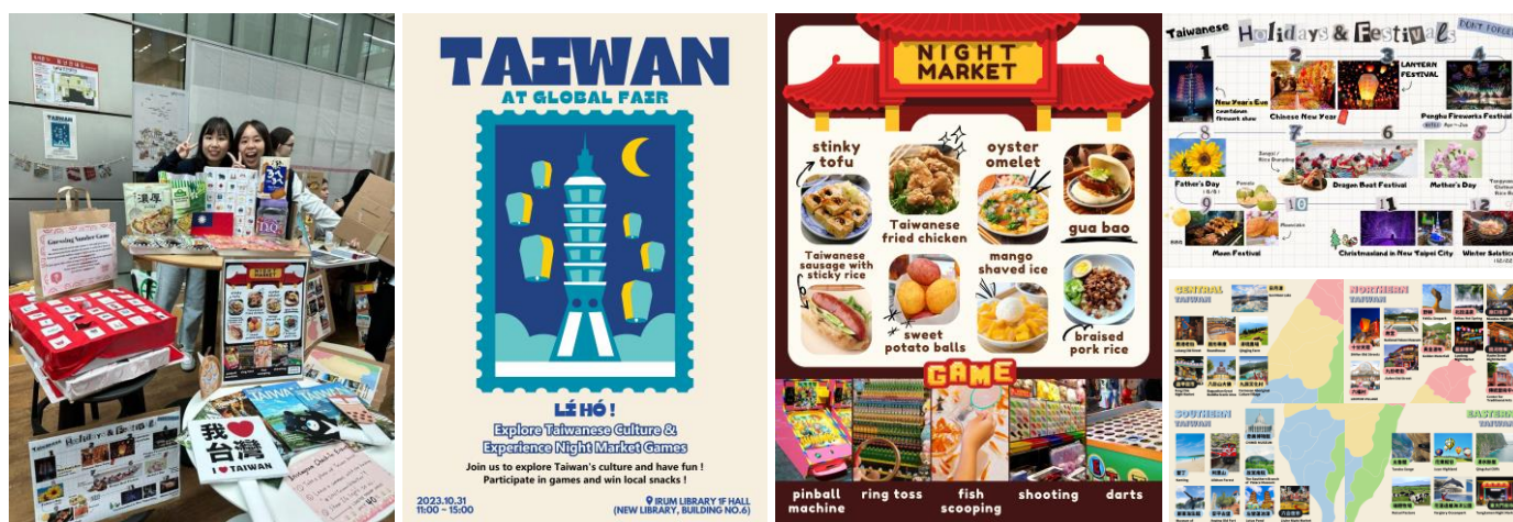
圖三：INU全球博覽會擺攤現場、文宣品

第一學期我有參與INU全球博覽會活動，此活動中我與另一位來自臺灣的同學一同規劃介紹臺灣的攤位，我負責了文宣海報的製作以及現場接待。在準備過程中因為同時還需顧及課業，人手也較不足所以花費了一些時間，但這也讓我更懂得如何去進行時間分配。活動開始後無論是接待韓國或外國學生，能讓更多人知道臺灣、認識臺灣文化，就是我當初想要報名的動力。再者聽到大家的回饋後也讓我覺得參與其中相當值得，與學生們互動的時候不僅加強了我的溝通能力，也使我更加勇於與人交流。