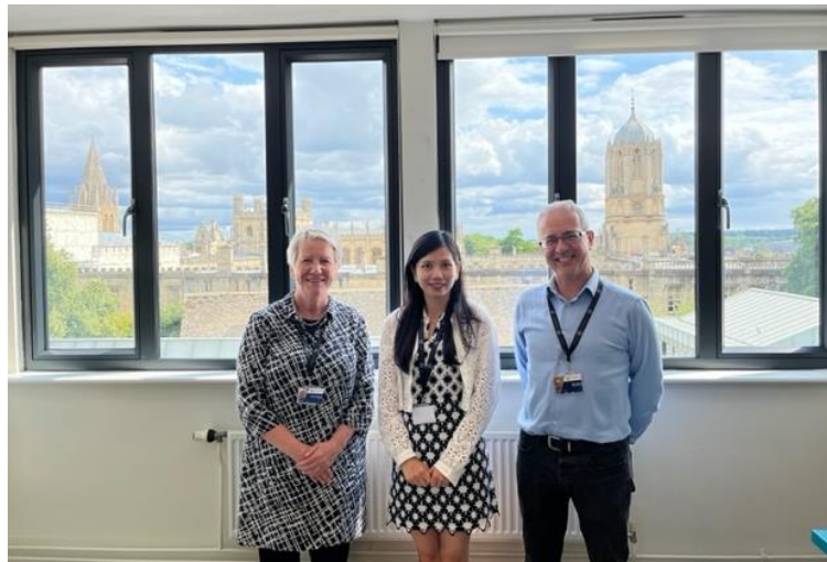
圖 9. 牛津大學邀請組長盈好教授與會 Oxford EMI 教學中心教授代表，一同討論英國與台灣教學現場施行狀況