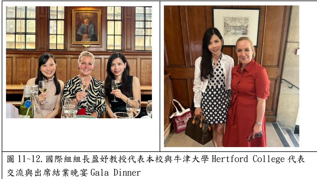
圖 11~12. 國際組組長盈好教授代表本校與牛津大學 Hertford College 代表交流與出席結業晚宴 Gala Dinner