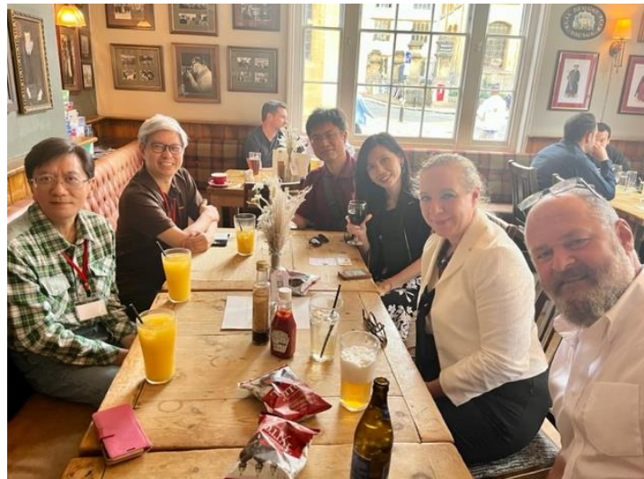
圖 10. 牛津大學 Hertford College 主辦交流之夜(Group Leader's night) ，組長盈好教授代表本校出席，並與其他暑期交流大學代表包括台灣大學國際處，東華大學國際處，香港樹仁大學等代表學者與國際處行政同仁交流