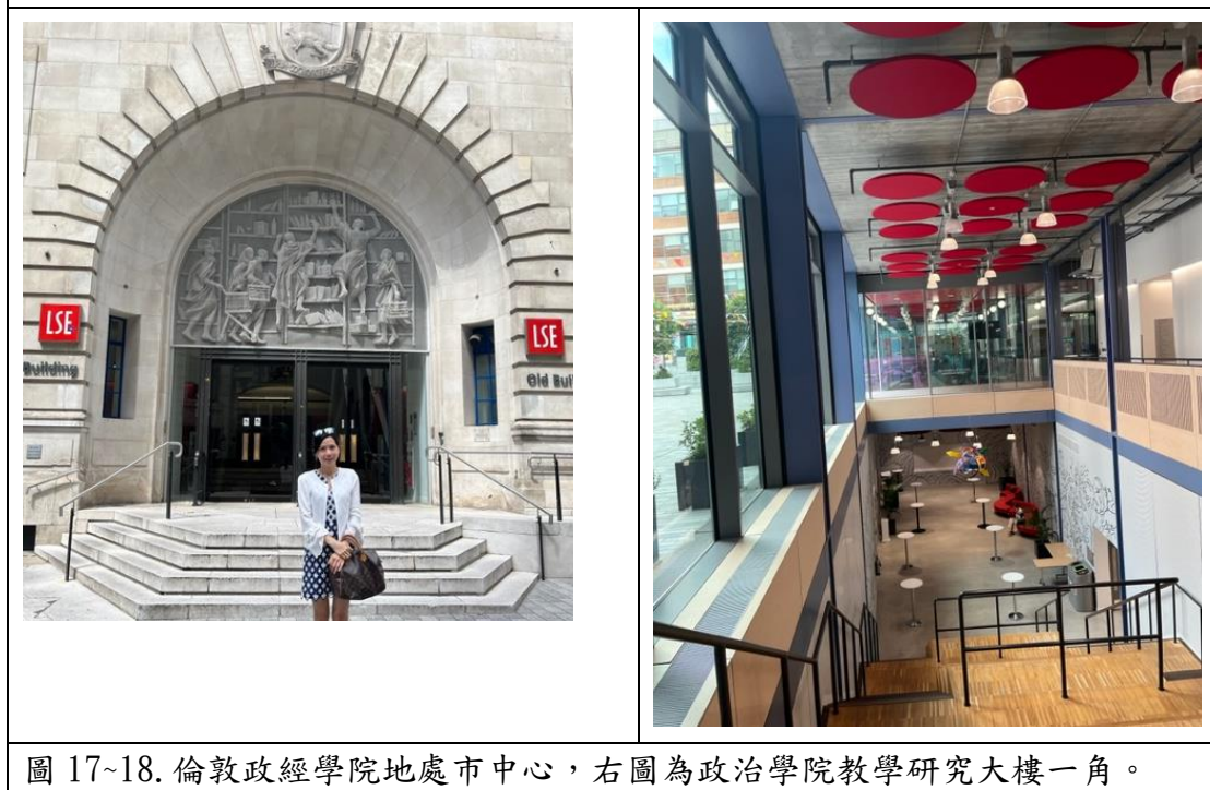
圖 17~18. 倫敦政經學院地處市中心，右圖為政治學院教學研究大樓一角。

7/15 牛津研習結束後，7/16-7/17 組長返抵倫敦並再次前往 Kings College London 與兩位校方代表 Benedict 先生會面，詳談與本校未來國際合作交流與研習的計劃細節，親自走訪國際學生課程講堂，圖書館，頂樓觀景台，會議室，電腦教室，深入討論未來國際生交流與研習課程的主題，課程規劃，學生食宿安排，交流活動方向等，由於近年來本校畢業生也有多名前往倫敦國王學院學院深造進修，貴校教育領域教學研究成果也是相當顯著，重點領域也與本校有許多可對應交流的項目，因此本組將延續此次的會面討論，持續討論未來國際交流合作之可能。