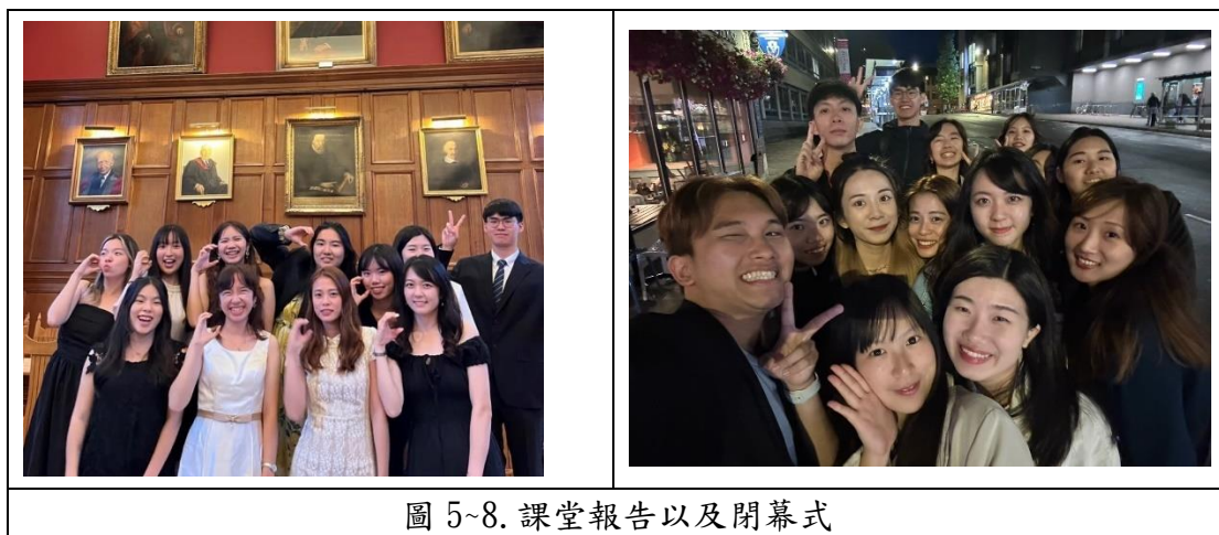
圖 5~8. 課堂報告以及閉幕式

行程中牛津大學特別慎重安排第三天和最後一天行程，包含前置任務報告、成果報告及閉幕式，由於英語老師及 RA 非常認真輔導，在成果報告及閉幕式當天皆順利進行且學生成果獲得肯定與讚賞。