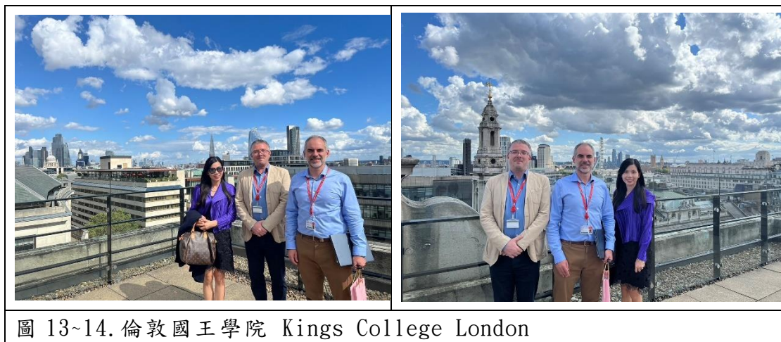
圖 13~14. 倫敦國王學院 Kings College London

組長此次行程特別提前抵達倫敦，於 7/1-7/4 期間代表本校前往英國倫敦拜訪當地國際知名的頂尖大學，包括倫敦國王學院 (Kings College London)，倫敦政經學院 (London School of Economics and Political Science/LSE) 等校，拜訪各校不同校區，國際事務辦公室，學術研究中心，語言中心等，進而介紹本校特色與近年國際交流重點走向，洽談姐妹校合作協議之可能性，說明本校年度國際盛事如教育年會，國際生交換，國際研討會，歐美研習團，優華語，國際教學助理招募，國際教學研究合作，國際生大手牽小手教學活動，海外教學實習，師生交流研習等相關事宜，積極為本校師生爭取國際交流機會。