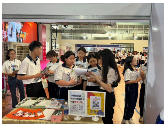
展覽宣傳及問卷填寫