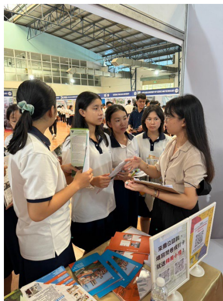
展覽宣傳及問卷填寫