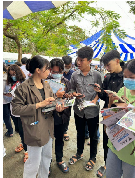
展覽宣傳及問卷填寫