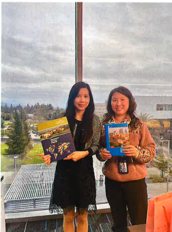
California State University, San Bernardino 校區國際姊妹校合約洽談代表會面