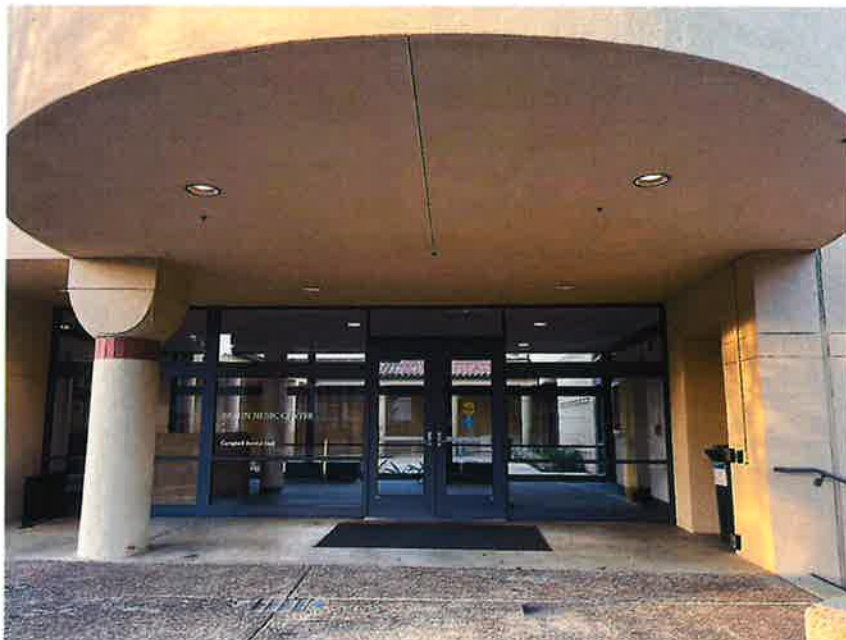
史丹福大學音樂中心會面 Braun Music Center