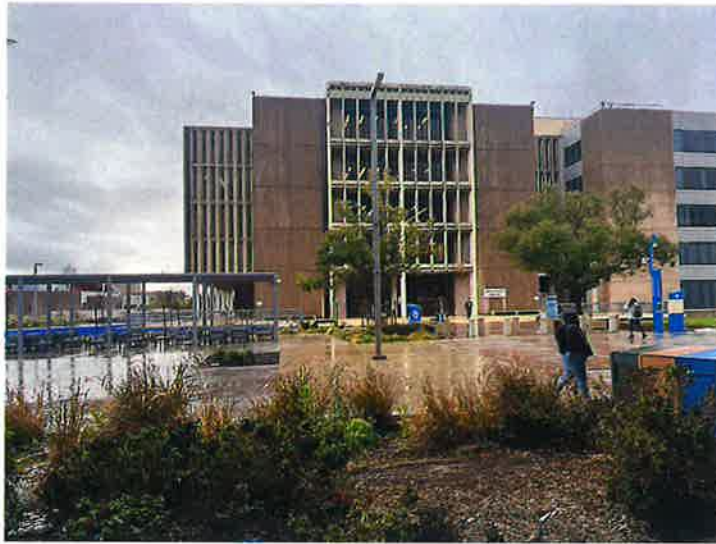
California State University, San Bernardino加州州立大學校區與行政大樓