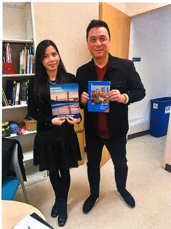
舊金山州立大學 San Francisco State University 與Director 會談