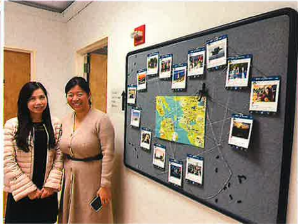
加州柏克萊大學國際訪問學位課程中心 (International Study Program)與代表們會談