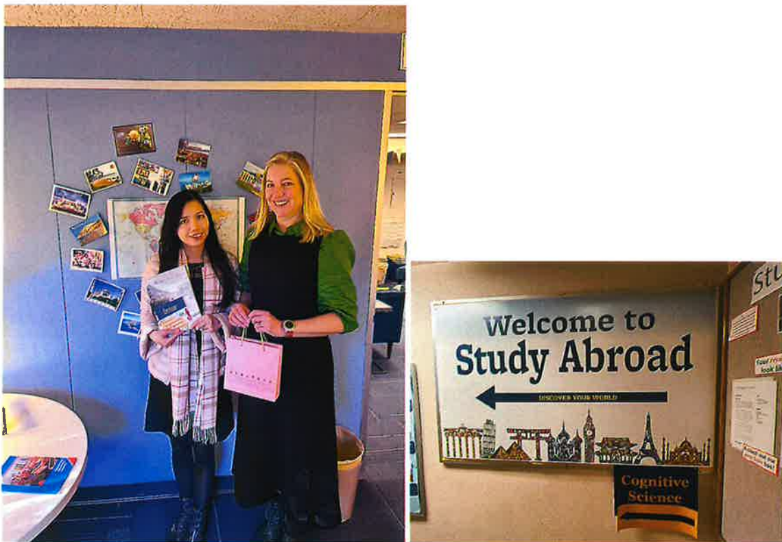
加州大學柏克萊大學國際事務Study Abroad 辦公室與代表會面洽談