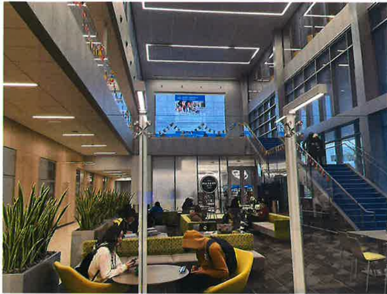
舊金山州立大學 San Francisco State University 國際大樓