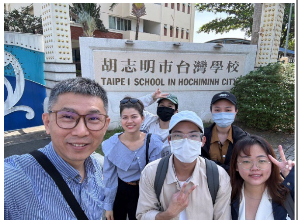
由胡志明市台灣學校江校長親自接待