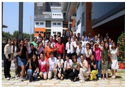
越華國際學校全體教職員