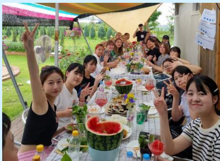
韩国传统游戏体验